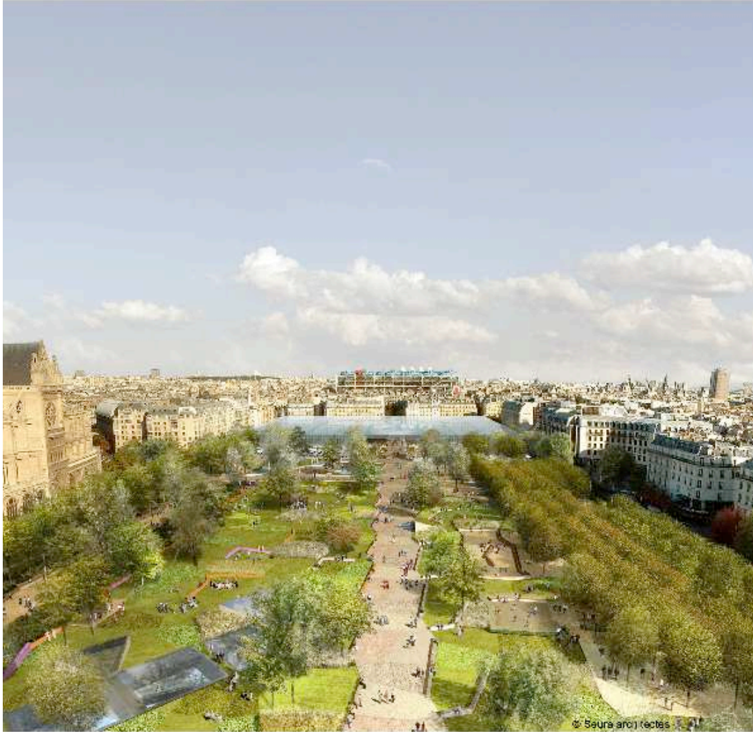
Vue du nouveau jardin depuis la Bourse vers le futur Carreau